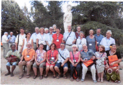
La délégation française au rassemblement européen de Madrid – août 2015

Participer à la «vie de famille» mariste dans la convivialité et au-delà du faire ensemble.